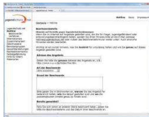
Unter www.jugendschutz.net kann man Verstöße gegen Jugendschutzbestimmungen melden.