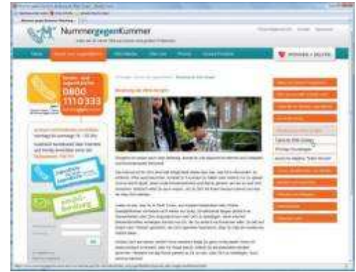
Beim Kinder- und Jugendtelefon „Nummer gegen Kummer“ erhalten Kinder und Jugendliche auch schriftliche Hilfe. Wer nicht anrufen mag, kann eine Mail schicken.