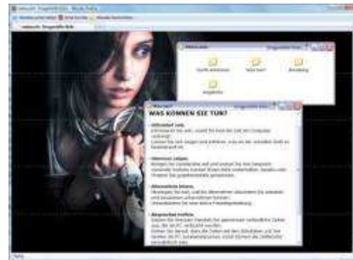
Cooler Aufmachung, klare Infos: Die Webseite www.websucht.info der Drogenhilfe Köln trennt die Bereiche mit Material für Jugendliche, Eltern und Pädagogen.