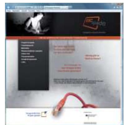
ESCapade ist ein familienorientiertes Modellprojekt für Jugendliche mit problematischer Computernutzung. Es richtet sich an Familien mit Kindern im Alter von 13 bis 18.