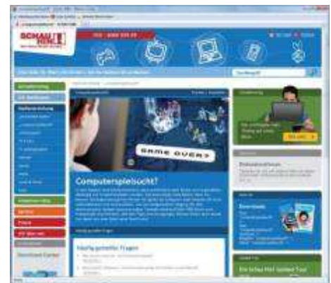
„Schau hin!“ ist eine Initiative vom Bundesministerium für Familie, Senioren, Frauen und Jugend, Vodafone, ARD, ZDF und TV Spielfilm. Die Webseite enthält auch Eltern-Informationen zu Computerspielen und Internetnutzung.